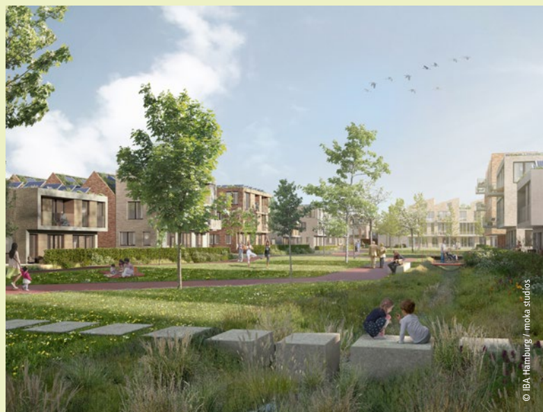
Das Blau-Grüne Band zieht sich durch das Quartier

Die bestehenden Landschaftslinien und teils historischen Wegebeziehungen in den Fischbeker Reethen bleiben erhalten und werden fingerartig in das Gebiet verlängert bzw. erweitert. In der Quartiersmitte wird ein künstlicher Teich zum zentralen Treffpunkt und zur idealen Kulisse für gastronomische Angebote, Einzelhandel oder Marktflächen. Zusätzlich entstehen im Verlauf eines in Ost-West-Richtung verlaufenden knapp 850 Meter langen Blau-Grünen Bandes Spielflächen für Kinder und Jugendliche, Bewegungsangebote für ältere Menschen, eine Urban Lounge sowie freie Spiel-, Sport- und Erholungsflächen.