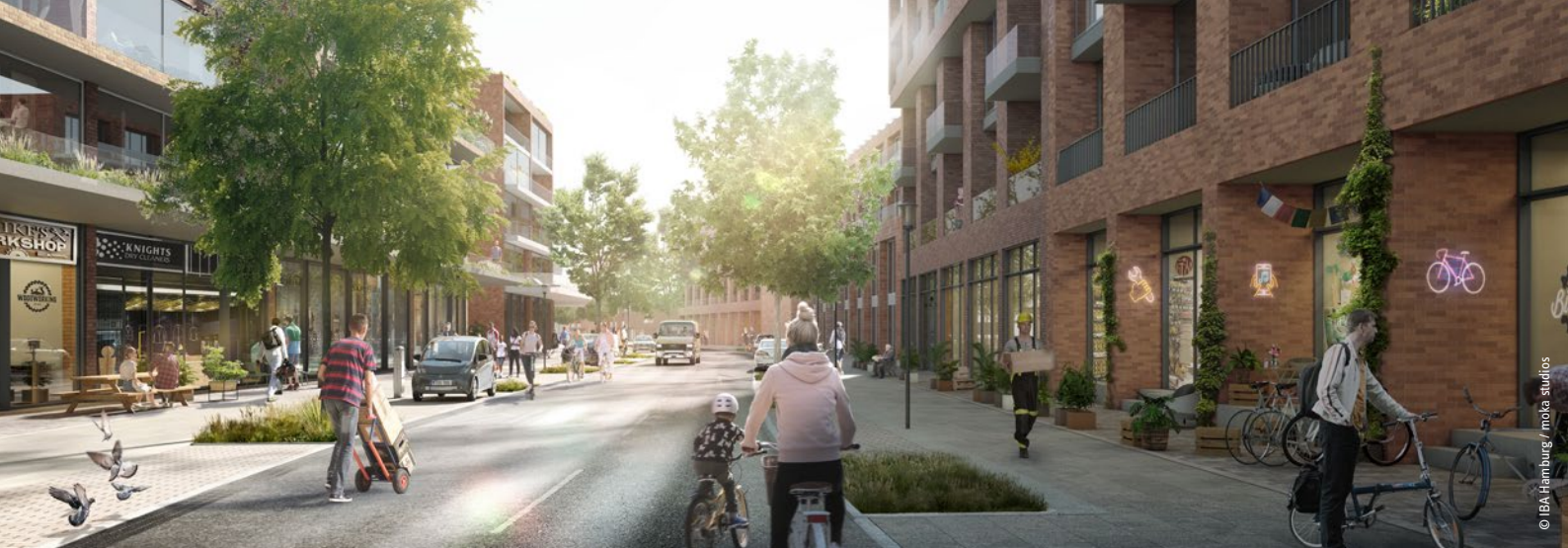
Sophie-Scholl-Straße mit Gewerbe und Dienstleistungsangeboten