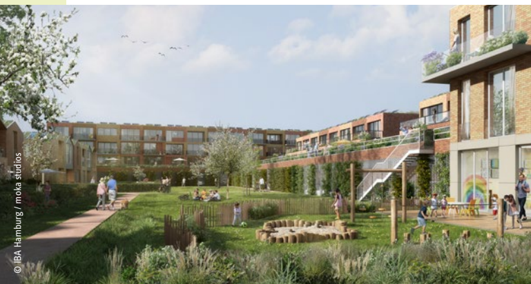
Grüne Innenhöfe und unterschiedliche Wohntypologien

Für die die Fischbeker Reethen wird ein Baugemeinschaftsanteil von bis zu 20 % angestrebt – das sind bis zu 460 Wohneinheiten . Unterschiedlichen Menschen soll damit bezahlbarer Wohnraum zur Miete oder als Wohneigentum ermöglicht werden. Die Mitglieder einer Baugemeinschaft sind direkt in den Planungs- und Bauprozess des gesamten Gebäudes und der dazugehörigen Freiflächen involviert. Es besteht auch die Möglichkeit, Wohnen mit gewerblichen Nutzungen zu kombinieren.